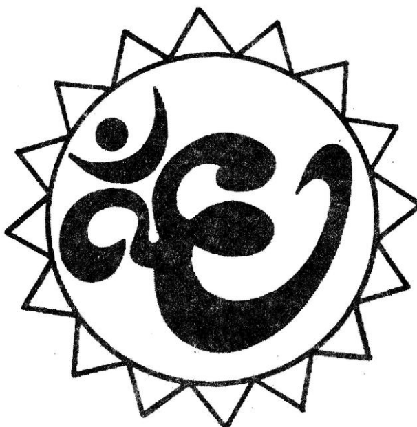
Рисунок для фиксации глаз

Вариант 3. Вокруг знака проведена окружность. Перемещайте свой взгляд по окружности, двигая одновременно глаза и голову. Делайте упражнение вначале с открытыми глазами, затем с закрытыми, представляя окружность.